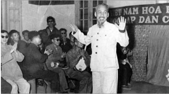
Bác Hồ thăm trại điều dưỡng thương binh ở Bắc Ninh

riêng. Suốt 24 năm trên cương vị là người đứng đầu nhà nước, Bác đã cùng Chính phủ thể chế hóa tư tưởng đó thành văn bản pháp quy của Nhà