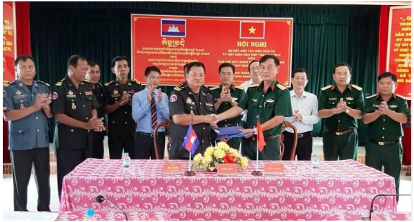
Ký kết biên bản hợp tác năm 2019

lượng vũ trang 02 bên trong quá trình ổn định tình hình an ninh biên giới. Chú trọng công tác trao đổi thông tin, các vấn đề liên quan đến tình hình biên giới thông qua các cuộc họp mặt, giao ban định kỳ, trao đổi trực tiếp hoặc bằng