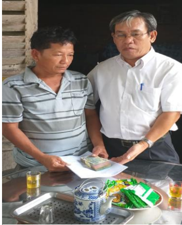
Chủ tịch Hội chữ thập đỏ tỉnh trao tiền cho gia đình