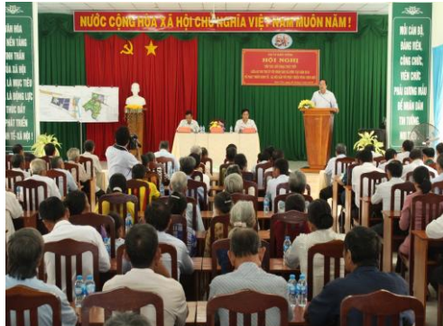
Quang cảnh hội nghị

Rà soát lại kết quả đạt được của từng tiêu chí xã văn hóa và xã nông thôn mới theo quy định hiện hành của trung ương, của tỉnh. Trong đó những tiêu chí đã đạt 100% thì tiếp tục củng cố, giữ vững và nâng chất; những tiêu chí đạt