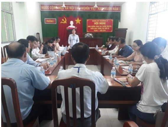
Hội nghị định hướng công tác tuyên truyền và triển khai thông tin thời sự

mặt trận các đoàn thể duy trì tốt chế độ báo cáo định kỳ và báo cáo đột xuất khi có vấn đề phát sinh, đặc biệt là những vấn đề liên quan đến tình hình an ninh trật tự, vấn đề nhạy cảm, phức tạp. Duy trì việc họp giao ban đội ngũ báo cáo viên,