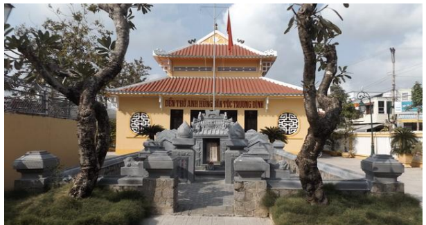
Mộ và đền thờ Trương Định ở Tiên Giang